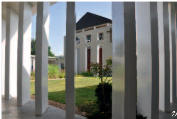
Le monastère de Bouzy-la-Forêt

Voici déjà douze ans que nous avons quitté la banlieue d'Orléans pour devenir bulzaciennes, très bien accueillies par les habitants de notre petite commune, venus nombreux dès la pose de la première pierre, le 25 juillet 1998. Notre aumônier, fidèle participant aux diverses animations du village, a largement contribué à notre insertion.