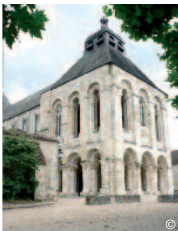
la tour de Gauzlin

La vie à Fleury à cette époque, son horaire, ses coutumes, ses activités, nous sont très bien connus grâce à un document exceptionnel, un véritable reportage, unique en son genre, dû au moine Thierry, d'origine allemande.