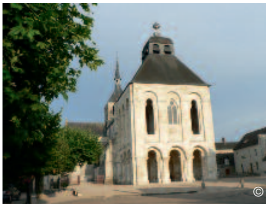
La tour porche

C'est, en avant-corps de la nef, l'imposante tour carrée qui évoque précisément cette Jérusalem d'en haut dont nous parle saint Jean dans le livre de l'Apocalypse (ch. 21) ; aussi bien son architecture que sa magnifique collection de chapiteaux historiés en sont directement inspirées. L'un deux, bien en évidence sur une colonne engagée de la façade ouest de la tour, qui écrit dans la pierre la vision inaugurale de saint Jean, au ch. 1 er , ne peut manquer de parler tout spécialement au cœur du moine ; dans l'adresse que saint Jean destine aux sept églises d'Asie « de la part de Jésus Christ, le témoin fidèle, le premier-né d'entre les morts, le souverain des rois de la terre », ces cinq petits mots : « à lui qui nous aime... » Le contraste est saisissant entre la sobriété de cette incise et la description grandiose de ce fils d'homme entrevu par saint Jean. Il nous aime : le désir du moine est de répondre amour pour amour : « ne rien préférer à l'amour du Christ » ( Règle de saint Benoît , 4,21).