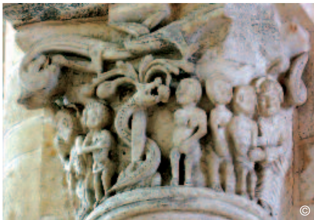
La faute originelle

Dans l'abside, près de l'autel de saint Benoît, au premier niveau de l'arcature à trois élévations, côté sud, le chapiteau d'Adam et Eve met en relief la désobéissance et la volonté propre alors que celui d'Abraham et d'Isaac, en vis-à-vis, évoque l'obéissance et l'abandon à la volonté de Dieu. En disposant ces deux scènes bibliques en regard l'une de l'autre, le sculpteur, par une heureuse inspiration, a illustré les dispositions du cœur de l'homme telles que saint Benoît les oppose dans sa Règle : « Écoute, mon fils, les préceptes du Maître, incline l'oreille de ton cœur, accueille de bon gré l'enseignement du Père qui t'aime, et mets-le parfaitement en pratique ; ainsi par le labour de l'obéissance, tu reviendras à celui dont t'éloignait la lâcheté de la désobéissance » ( RB , prol. 1-2 ; cf. 1,19-21).