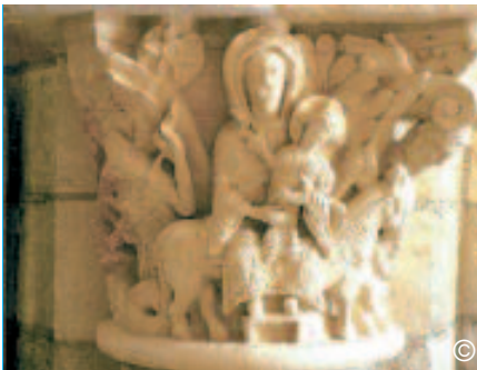
Le chapiteau de la femme de l'Apocalypse

À l'entrée occidentale, le Christ Juge (Ap 1,9-20), agneau immolé et lion de Juda (5,5-6), vivant arbre de vie (22,14) est la porte car nul ne va au Père que par le Fils (Jn 10,9.30). Les douze portes de la cité sainte figurent les douze apôtres (Ap 21,14) car c'est par eux que nous entrons dans le Royaume des cieux : « Pourquoi les apôtres sont-ils des portes ? Parce que c'est par eux que nous entrons dans le royaume de Dieu : en effet, ils nous le prêchent. Et puis que nous entrons par eux, nous entrons par le Christ : lui-même est en effet la porte. Il est dit en effet qu'il y a douze portes à Jérusalem, et une seule porte, le Christ, et les douze portes sont le Christ, parce que le Christ est dans les douze portes » 2 .