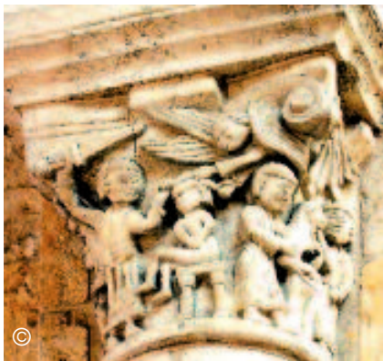
Abraham et Isaac

Face au chapiteau d'Adam et Eve, nous avons celui d'Abraham. Lui, combat en obéissant à l'ordre de Dieu. Il sacrifie sa propre chair dans l'offrande de son unique descendance. Il obéit à Dieu. Il acquiert ainsi la vraie sagesse et il sera comblé de bénédictions. Sa postérité sera aussi nombreuse que les étoiles dans le ciel et que le sable qui est au bord de la mer ( Gn 22, 1-17). Cependant, Dieu épargne Abraham :