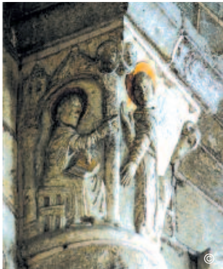
Maur marche sur les eaux

À son retour, il raconta au Père ce qui s'était passé. Cependant le vénérable Benoît attribua le prodige non à ses propres mérites mais à l'obéissance de Maur. Celui-ci disait, au contraire, que cela était arrivé grâce au seul commandement du Père et qu'il n'était pour rien dans ce qu'il avait accompli sans le savoir. Mais l'enfant sauvé intervint dans cet amical débat d'humilité : « Moi, dit-il, quand on m'a tiré de l'eau, je voyais la melote de l'Abbé au-dessus de ma tête et je pensais que c'était lui qui me sortait du lac » (Grégoire le Grand, Dialogues II , 7).