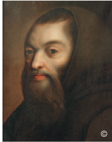
Joseph Du Tremblay

cloître. Là, plusieurs dizaines de jeunes filles, conquises par l'ardent désir de Dieu qui animait Madame d'Orléans et par sa grande bonté, viennent suivre son exemple et son enseignement ; Lencloître connaît alors un rapide et large rayonnement. Mais l'opposition de la nouvelle abbesse de Fontevault empêche le développement du monastère. Aidée par le père Joseph Du Tremblay, conseiller de Richelieu, Madame d'Orléans décide de quitter l'ordre de Fontevault ; en 1617, elle fonde à Poitiers la Congrégation des Bénédictines de Notre-Dame du Calvaire qui connaît un essor rapide : en vingt ans, seize maisons voient le jour dont deux à Paris ; l'une au Luxembourg, près du palais de Marie de Médicis (aujourd'hui appartements du président du Sénat), l'autre dans le quartier du Marais, évoquée seulement par la rue et la station de métro Filles du Calvaire .