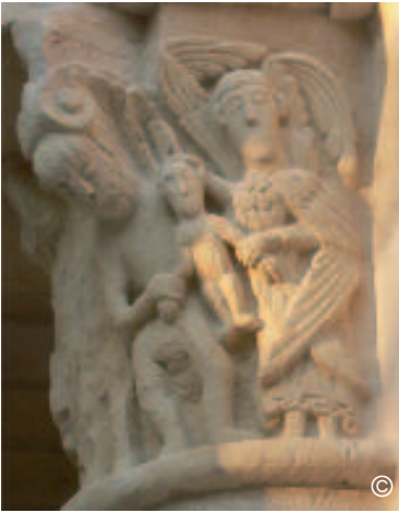
Le chapiteau de l'âme partagée

Gaule de son temps. Aussi, voit-on, à droite, le dragon (Satan) léchant la poussière du sol au pied de l'ange thuriféraire (12,10).