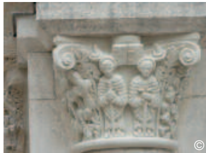
Les deux témoins

Le récit présente un certain parallélisme avec celui de la femme et de l'Enfant Dieu ( Ap 12 ) évoqué au centre de la tour. Les deux épisodes suggèrent les mêmes caractéristiques de passion, mort et résurrection. C'est l'une des raisons du choix de cet épisode pour figurer sur ce chapiteau à la place de l'ancienne sculpture disparue.