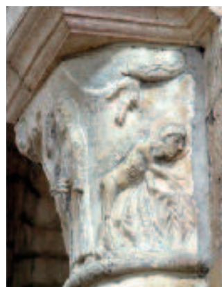
Chapiteau du buisson de ronces