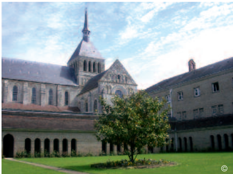
le cloître actuel

frère Lin Donnat, moine de Fleury.