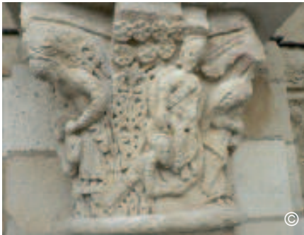
Le Christ glorieux

Construite à l'origine comme un monument indépendant, isolé de l'abbatiale, la tour de Gauzlin évoque la Jérusalem céleste aux douze portes (Ap 21,9-27) avec, illustrés dans les chapiteaux du centre, les mystères du Christ et de son Eglise, et ceux de la périphérie, les compromissions avec le monde et le combat spirituel contre les forces du mal 1 .