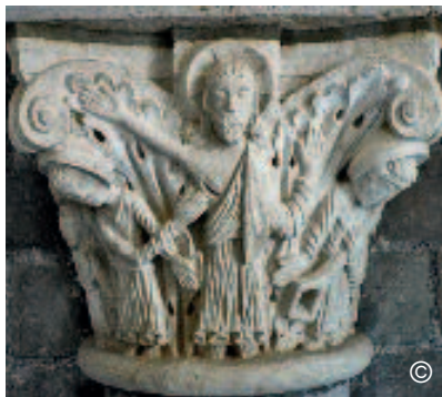
L'incrédulité de saint Thomas

L'incrédulité de saint Thomas ( Jn 20,14-29 ). Thomas ne croit pas les apôtres qui lui annoncent que Jésus leur est apparu ressuscité. Peu après, Jésus se manifeste à lui alors que tous sont réunis dans la salle, les portes étant verrouillées. Jésus dit à Thomas : « Avance ta main et mets-la dans mon côté, ne sois pas incrédule, sois croyant ». Thomas reconnaît son manque de foi. Jésus lui dit : « Parce que tu m'as vu, tu crois ; heureux ceux qui croient sans avoir vu. »